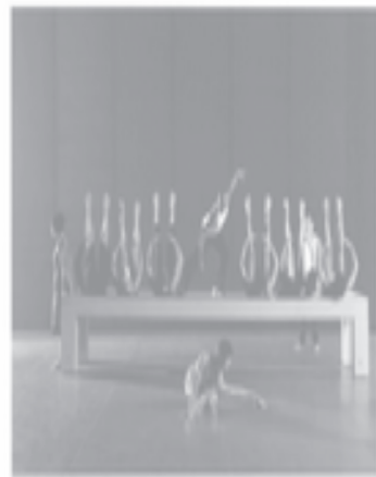
Cia de dança Deborah Colker se apresenta em Barra do Piraí